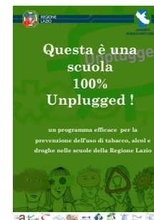
Locandina per le scuole aderenti.

Unplugged è un programma scolastico di prevenzione dell'uso di sostanze elaborato e valutato nell'ambito dello studio multicentrico sperimentale randomizzato e controllato EU-Dap (European Drug Addiction Prevention trial) condotto in 7 Paesi europei 4 . Si basa su un modello di influenza sociale globale CSI (comprehensive social influence approach), che include una equilibrata miscela di nozioni teoriche, di sviluppo di abilità sociali, emotive o perso-