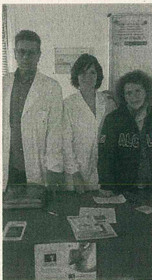
Asl e Alci insieme Per sensibilizzare e fare prevenzione per le donne